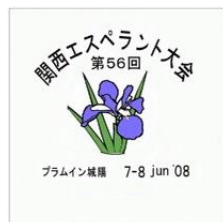
関西大会の シンボルマーク

期日：6月7日(土)～8日(日) 会場：プラムイン城陽(京都府城陽市) ホームページ http://www.geocities.jp/kongreso2008/