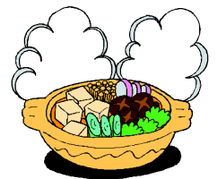
Manjajo kuirata en kaserolo