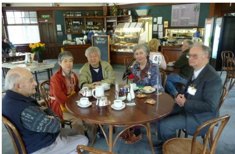
クライストチャーチにて(筆者は左から3人目)

南島にある落ち着いた町。秋で、日本の11月にあたり、街路樹の葉が黄色く色づいている季節であった。4月20日、世界エスペラント協会(UEA)の都市代表(delegito)の方がホテルまで車で迎えに来て、市内の植物園に向かう。園内の喫茶店で、他の4人の方と会い、歓談、あとで園内を散策する。90歳以上の年の方、勤め先を一時抜け出して来た方などがいた。なかなか新しいエスペランティストが出てこないという悩みを聞く。夕方ホテルに戻るが、別途この方と奥様とは夕食をとった。この国では公立の学校や病院は無料ということだが、「命に別状ない人は後回しにされてかなり待たないとだめ」という話もあった。