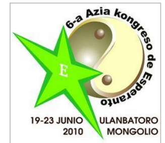
第6回アジア大会のシンボルマーク

長崎・日本大会のLKK(現地大会委員会)のメンバであるRH会員からの依頼により、ホームページのアドレスにRHが所有している esperanto.jp のウェブサイトをお貸ししています。