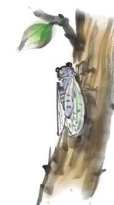
Cikado ĉirpas en somero.

第57回関西エスペラント大会の2日目、6月7日に「エスペラント・ミニ大学」(Esperanto-Universitato)を開催し、3テーマを発表しました。 (2・3 ㊦参照)