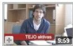
UEA viva n-ro 2