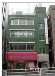
エスペラント会館 (東京都新宿区)