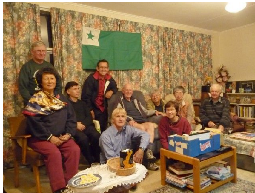
オークランドにて(筆者は右から4人目)