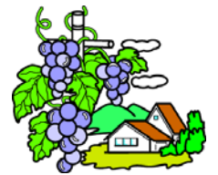
Vinberoj kaj domo