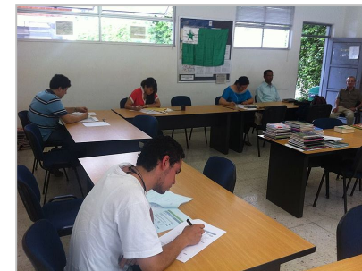
コロンビアでの受験(6月8日)

昨年6月9日、世界一斉の試験(筆記試験のみ)が行われました。今年も6月8日(土)午後4時から実施され、16カ国27都市で243人が受験しました。東京会場では5人が C1レベルを受験し、全員合格しました。