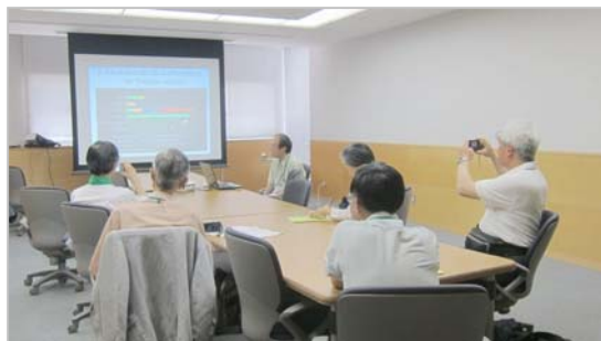
2014年6月1日のミニ大学