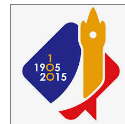
第100回世界大会 シンボルマーク

第1回世界大会は1905年にフランスのブロニュ＝シュル＝メールで開催されました。そして、今年、第100回世界大会が7月25日～8月1日にフランスのルールにて開催されます。詳細は14頁参照。