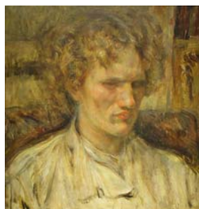
『エロシェンコ像』 中村 彝 作

ヴァスィリー・エロシェンコ (1890 年 1 月 12 日～1952 年 12 月 23 日) は 4 歳で失明し、モスクワ盲学校に学び、その後エスペラントを学びました。1914 年に、日本の按摩術を勉強するため、当時の東京盲学校に留学しました。級友にエスペラントを教え、当時の知識人、文化人と幅広く交流しました。日本語で童話もたくさん創作しました。